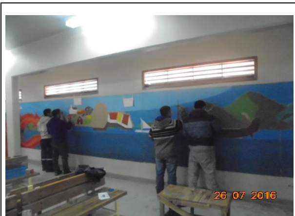
IMG. N° 002 Reinserción Social: CP Puerto Montt.

Comentario: Con fecha 26-07-2016 se fiscaliza Taller Cultural 803-03 de pintura, correspondiente al Sub Programa de Deporte Recreación Arte y Cultura, ejecutado en dependencias del módulo 54, contando con la participación de 8 internos.