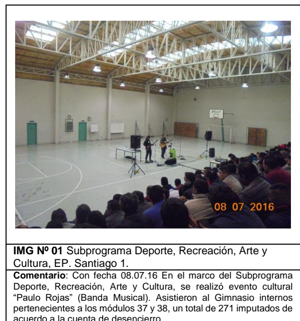
IMG N° 01 Subprograma Deporte, Recreación, Arte y Cultura, EP. Santiago 1.

Comentario: Con fecha 08.07.16 En el marco del Subprograma Deporte, Recreación, Arte y Cultura, se realizó evento cultural "Paulo Rojas" (Banda Musical). Asistieron al Gimnasio internos pertenecientes a los módulos 37 y 38, un total de 271 imputados de acuerdo a la cuenta de desencierro.