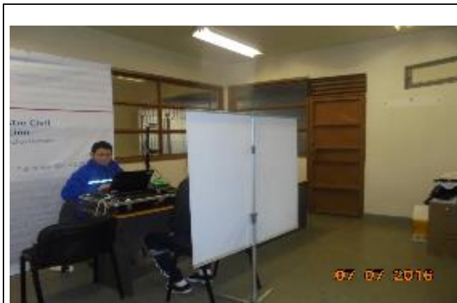
IMG. N° 03 Reinserción Social: CP Valdivia

Comentario: Con fecha 07-07-2016, se realiza operativo de Registro Civil e Identificación.